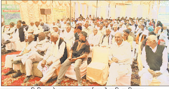
बहादुरगढ़। कृषि विभाग के जागरूकता कार्यक्रम में उपस्थित किसान।