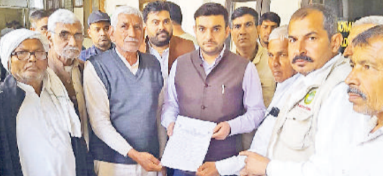
बहादुरगढ़। एसडीएम को ज्ञापन सौंपते असंगठित कामगार एवं कर्मचारी कांग्रेस के पदाधिकारी।