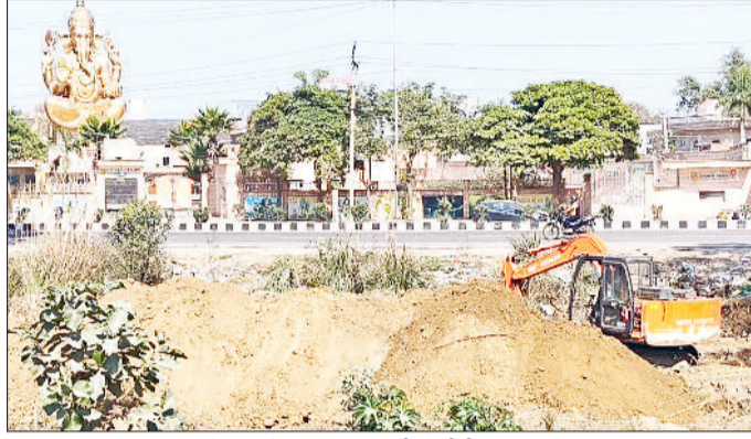
बहादुरगढ़। गणपति धाम के सामने डायवर्जन बनाती जेसीबी।

■ ओमेक्स के निकट से लेकर बाड़पास पर पीडीएम यूनिवर्सिटी के पीछे तक दोबारा बनाई जाएगी सड़क