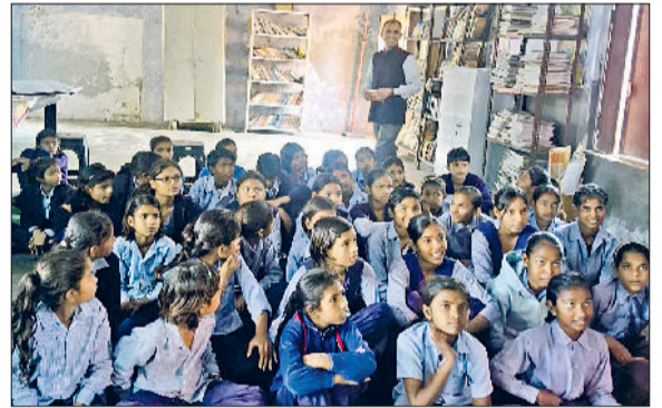
झज्जर। कार्यक्रम में उपस्थित छात्राएं एवं विषय विशेषज्ञ।