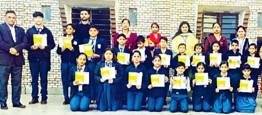
झज्जर। शिक्षकों के साथ मंच पर उपस्थित साइंस ओलंपियाड के विजेता विद्यार्थी।

अधिकारियों पर न काम देने की जवाबदेही बनती है, न ही मजदूरों को काम न मिलने पर मुआवजा ही मिलता है। मंजुरों को काम के समय चोट या सांप आदि के काटने पर भी न तो मुआवजा मिलता है न ही कोई सहायता। पूरा काम करने पर भी खाते में