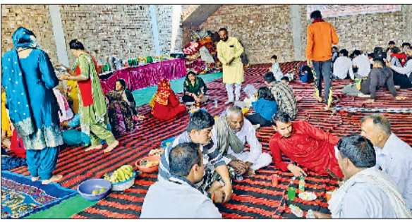
झज्जर। सांपला बाड़पास के नजदीक पदयात्री शिविर में ठहरे श्यामभक्त।

इसी श्रद्धा को नमन करने और पदयात्रियों की थकान मिटाने के लिए श्रद्धालुओं द्वारा जगह-जगह सेवा शिविरों का आयोजन भी किया जा रहा है। शहर के सांपला मार्ग पर भी जिले के गांव रोहद निवासी श्रद्धालुओं द्वारा नौवें पद यात्री शिविर का आयोजन किया गया है।