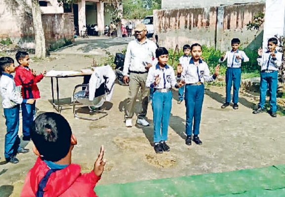
झज्जर। राजकीय विद्यालय सुर्खपुर में अंतरराष्ट्रीय मातृभाषा दिवस की तैयारियों में जुटे शिक्षक एवं विद्यार्थी।

एफएलएन समन्वयक व स्कूल मुखियाओं को पत्र भेजकर स्कूल में मातृभाषा दिवस मनाए जाने के निर्देश दिए गए हैं। पत्र में कहा कि इस दिवस को मनाए जाने का उद्देश्य भाषा विविधता और सांस्कृतिक धरोहर के संरक्षण बारे जागरूकता फैलाना है। पत्र में दिए गए निर्देशानुसार सुबह के समय प्रार्थना सभा में अंतरराष्ट्रीय मातृभाषा दिवस के महत्व पर चर्चा करना तथा उसके उपरांत कक्षाओं में अभिभावकों, दादा-दादी, एसएमसी सदस्यों को शामिल करते हुए दिवस से संबंधित किन्हीं दो गतिविधियों का आयोजन करना शामिल है।