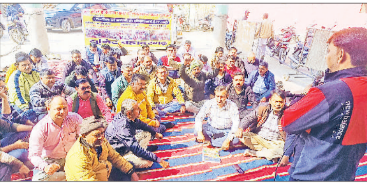
प्रदर्शनकारी बोलें- एसडीई ने हाल ही में महिला जेई के साथ भी किया था दुर्व्यवहार बेवजह किया जा रहा परेशान