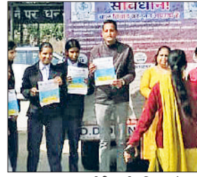
झज्जर। गुदा आईटीआई परिसर में जागरूकता सामग्री के साथ उपस्थित छात्राएं व टीम सदस्य।

लागत में अधिक उत्पादन के लिए प्राकृतिक तरीकों को अपनाना समय की आवश्यकता है। कविता ने पोषक अनाजों की खेती, उनके बाजार मूल्य और स्वास्थ्य लाभों की जानकारी दी।